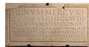
Écriture capitale romaine ou capitale carrée.

La capitale romaine ou capitale monumentale ( capitalis monumentalis ), dite aussi capitale carrée, est une écriture considérée comme la forme la plus parfaite et la plus aboutie de l'écriture latine, qui apparaît principalement gravée dans la pierre des monuments.