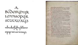
Écriture Carolingian minuscule

La minuscule caroline est une écriture apparue au viii e siècle , vers 780 sous l'impulsion de Charlemagne . Elle présente des formes rondes et régulières qui la rendent plus facile à lire et à écrire que la minuscule mérovingienne . Sa clarté favorise sa renaissance au xv e siècle , sous la forme de l' écriture humanistique diffusée par des humanistes florentins qui l'ont redécouverte et préférée à l'écriture gothique, qu'ils jugeaient artificielle et illisible.